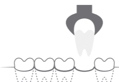
Perdita del dente